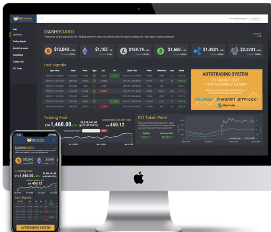
Fox Trading BETA platform - Desktop en App

In het dashboard kunnen gebruikers ook de algemene prestatie van de robot inzien, alsook de inkomsten van de Trading Pool die ze maandelijks of per kwartaal ontvangen.