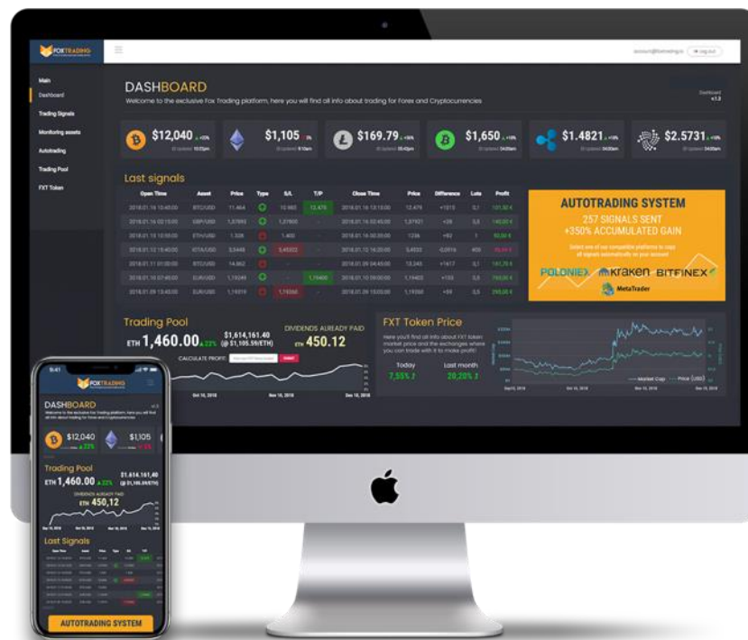
Fox Trading BETA platform - Desktop and App

Di dasbor, pengguna juga akan melihat kinerja robot dan pendapatan global yang dihasilkan oleh Trading Pool yang akan mereka dapatkan setiap bulan atau kuartalan..